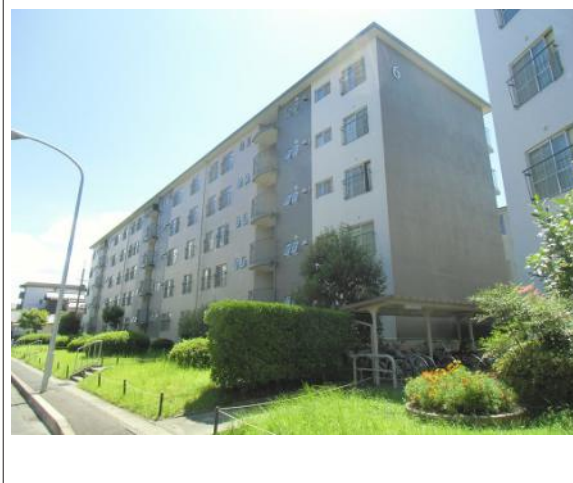
写真 JR・京阪膳所駅