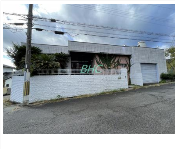
写真 爽やかな青空の下に贅沢なほどに降り注ぐ陽光、豊かな居住性と