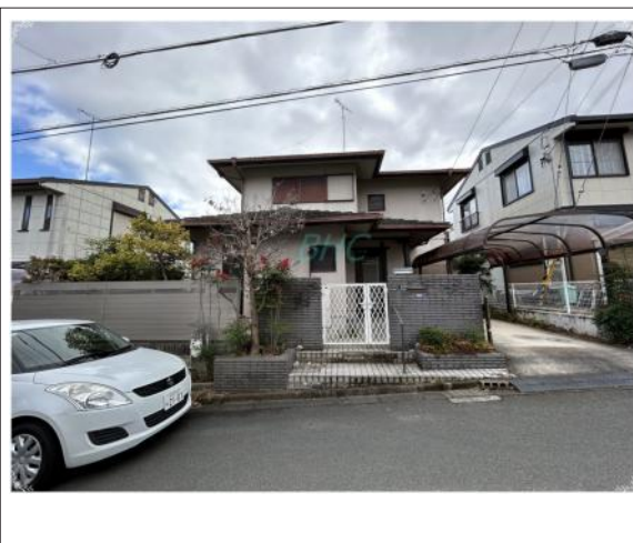
写真 交通量の少ない道路に面していますので、ゆっくり時間をかけて