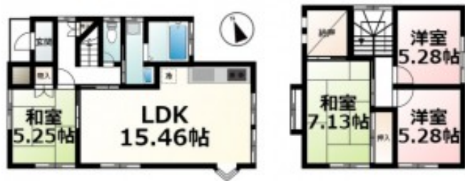
写真 陽当たりや通風・仕様設備やお部屋の大きさの比較、近隣・周辺環