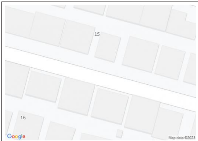
写真 陽当たりや通風・仕様設備やお部屋の大きさの比較、近隣・周辺環