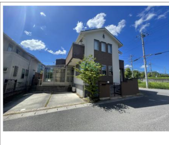
写真 当りや通風・仕様設備やお部屋の大きさの比較、近隣・周辺環境