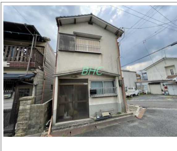
📷 写真 採光や風通しを考えた設計された間取り。