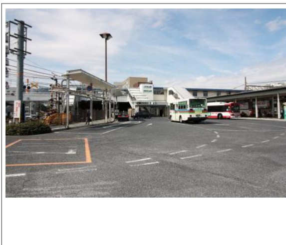
写真 京阪唐橋前駅