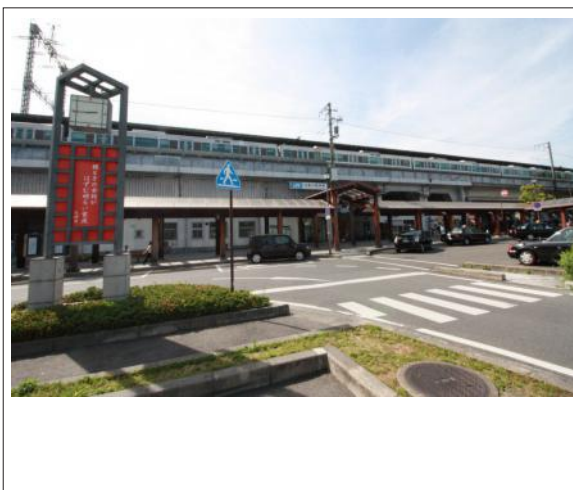
写真 JR比叡山坂本駅