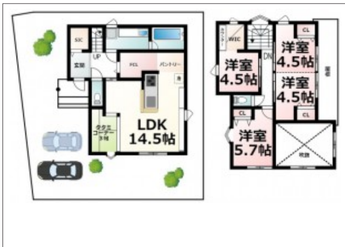
写真 京阪唐橋前駅