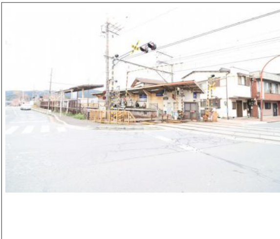
写真 京阪唐橋前駅