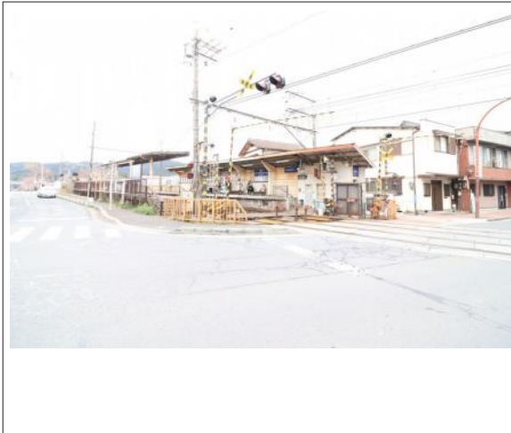
写真 京阪唐橋前駅