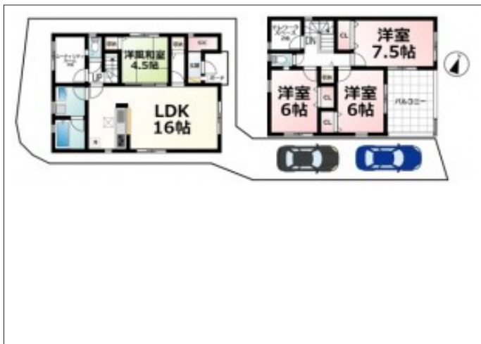
写真 その邸が魅せる、気品・上質・重厚感・極細やかさ、そのすべて