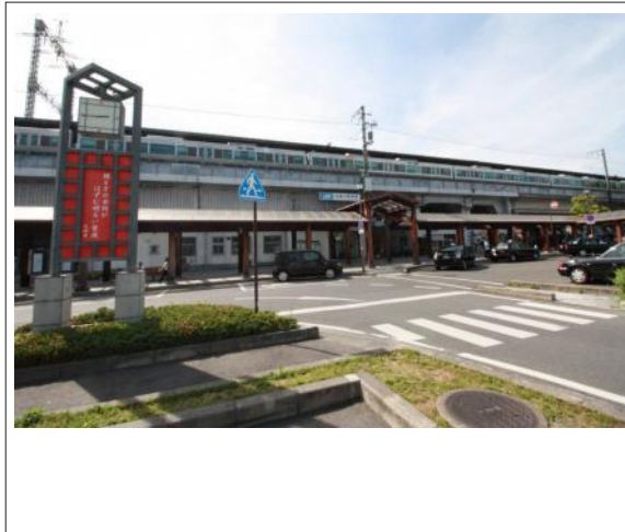
写真 JR比叡山坂本駅